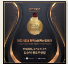
2022년 KCA 한국 소비자산업평가 1위 수상