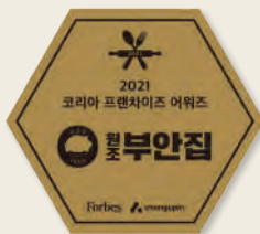
2021년 코리아 프랜차이즈 어워즈 수상