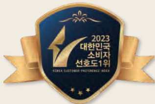
3년 연속(2021~2023) 대한민국 소비자선호도 1위 수상